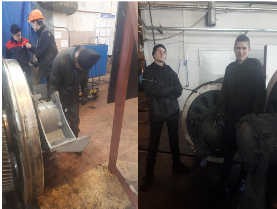
Слайд № 8