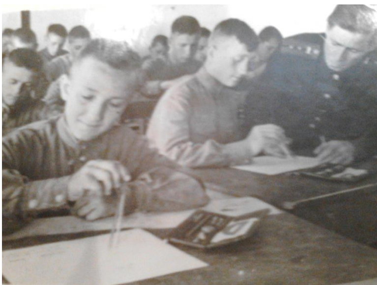
Слайд № 14 «Дисциплинированность»